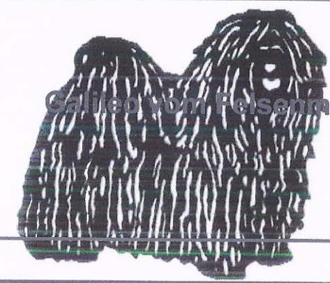
Galileo vom Felsenmeer